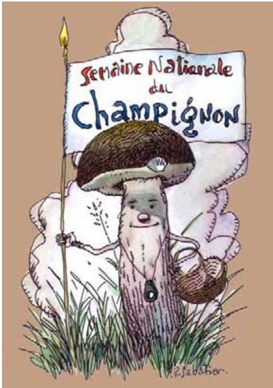
DESSIN ROLAND SABATIER