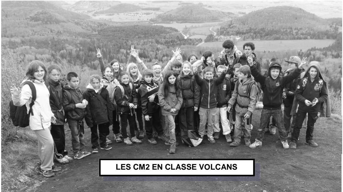
LES CM2 EN CLASSE VOLCANS

Nous sommes allés en Auvergne du mardi 22 jusqu'au vendredi 25 avril avec la classe de CM2 de St Laurent Du Pont.